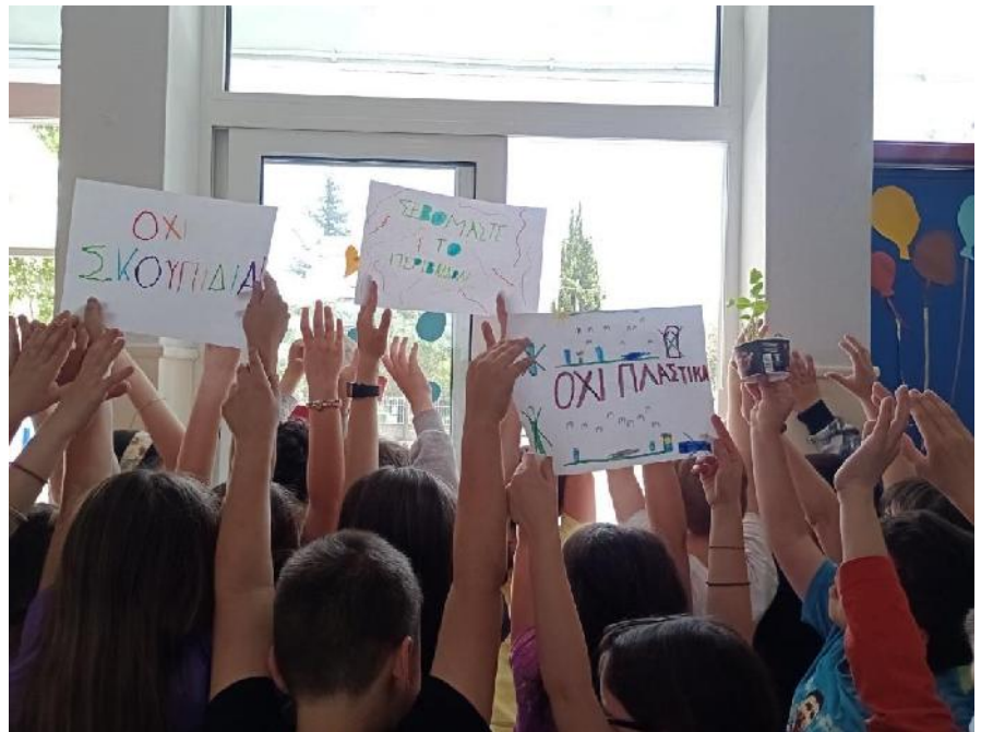
Οι μαθητές του Β1

Ζώα και παιδιά Μαζεύτηκαν ξανά Από πόλεις και χωριά Πήραν μολύβια και χαρτιά Πήραν και λίγα παγωτά Και πιάσανε δουλειά. Φτιάξαν ταμπέλες και πανό Με μηνύματα σωρό Τον κόσμο να βοηθήσουν Και οξυγόνο να χαρίσουν Συνθήματα φωνάζουν, Τα δέντρα αγκαλιάζουν, Ευγένεια μοιράζουν Και τον κόσμο μας αλλάζουν.